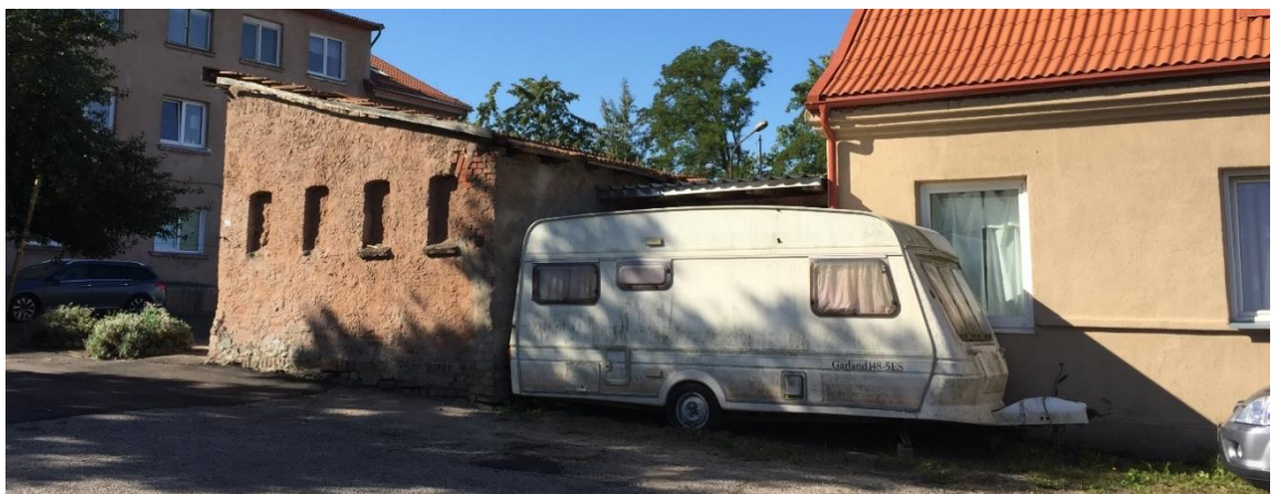
3 pav. Sandėliavimo paskirties pastato šalia Bangų g. 13, Klaipėdoje fotofiksacija