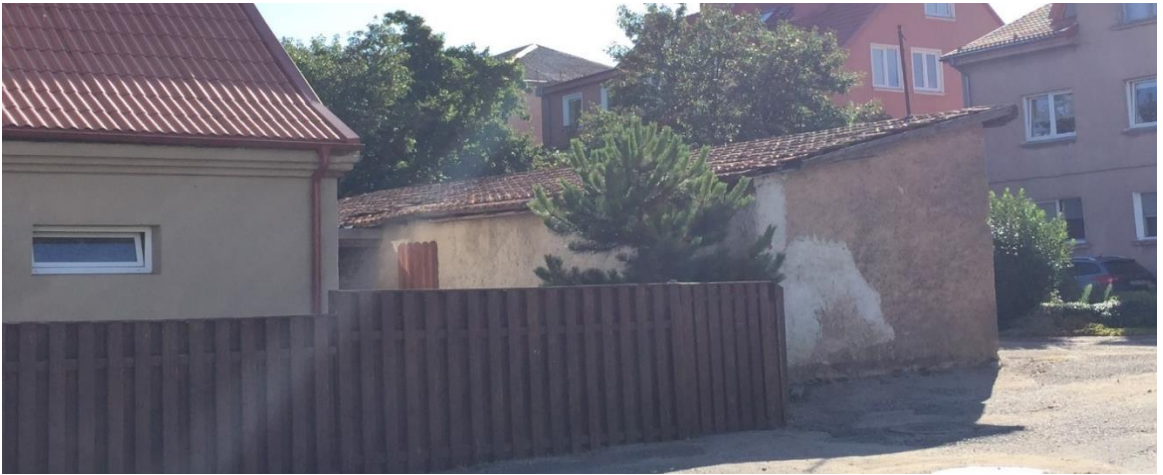
2 pav. Sandėliavimo paskirties pastato šalia Bangų g. 13, Klaipėdoje fotofiksacija