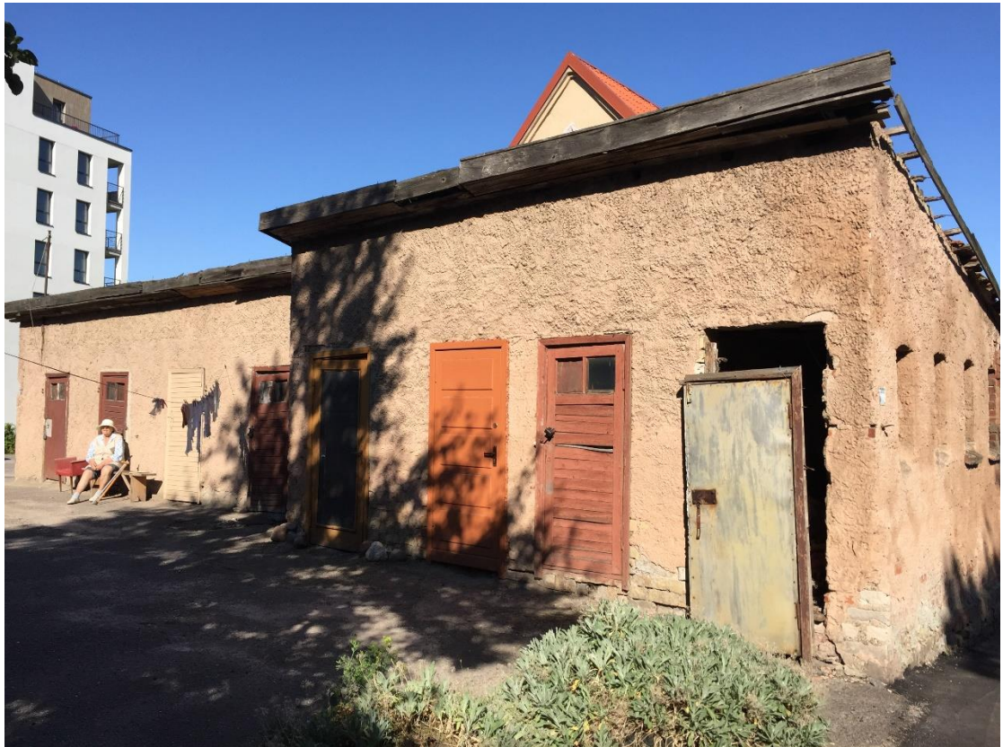
5 pav. Sandėliavimo paskirties pastato šalia Bangų g. 13, Klaipėdoje fotofiksacija