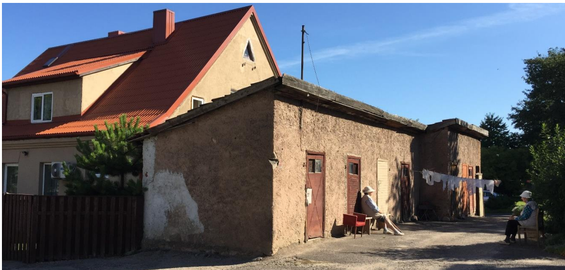
1 pav. Sandėliavimo paskirties pastato šalia Bangų g. 13, Klaipėdoje fotofiksacija