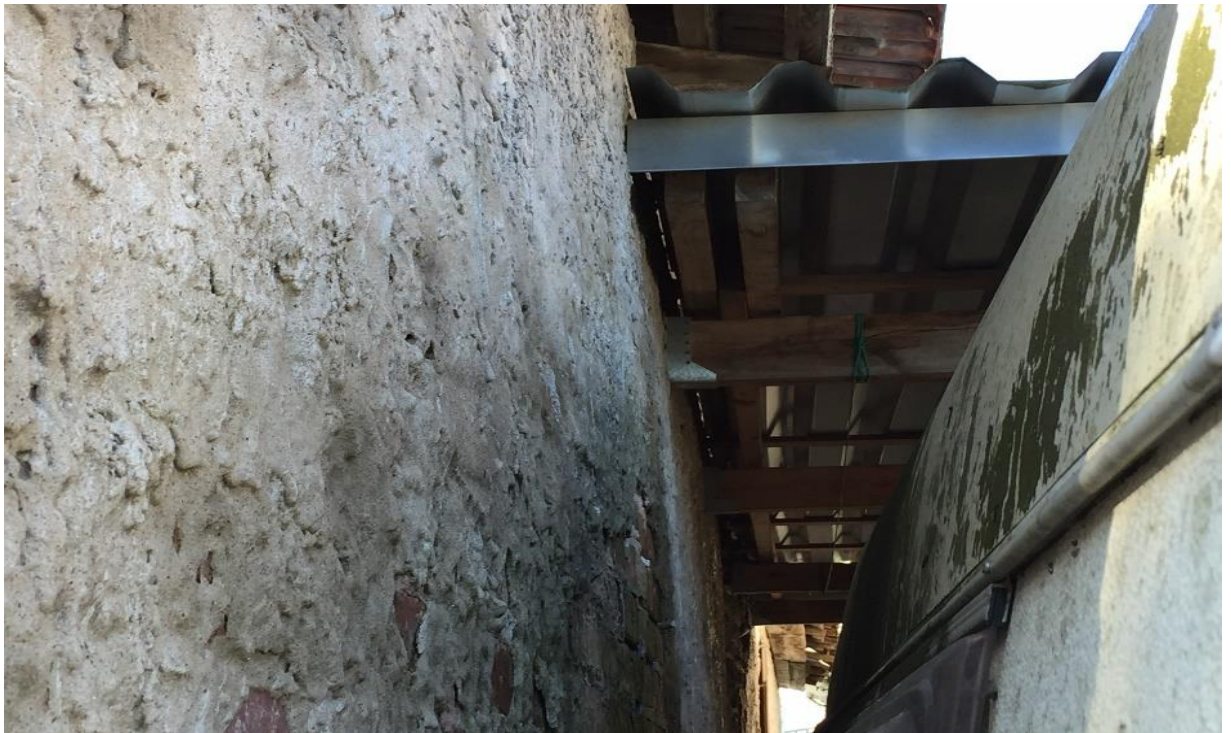
4 pav. Sandėliavimo paskirties pastato šalia Bangų g. 13, Klaipėdoje fotofiksacija